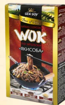
WOK по-японски: ЛАПША ГРЕЧНЕВАЯ SOBA, С СОУСОМ YAKISOBA И КУНЖУТОМ

Набор для WOK по-корейски «ЧАПЧЕ» поможет создать традиционное королевское блюдо на основе «стеклянной» лапши Harusame и соуса Chapchae. В древности «Чапче» придумали для короля, которому блюдо сильно понравилось, и благодаря чему быстро завоевало любовь корейцев.