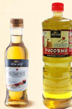
РИСОВЫЙ УКСУС «ДЛЯ СУШИ» JAPANESE TASTE Стекло ПЭТ 220 мл 1 литр ПВД 6 шт. ПВД 6 шт.