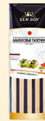
ПАЛОЧКИ ДЛЯ ЕДЫ Пластиковый пакет 5 пар палочек Show-box 10 шт. Короб 60 шт.