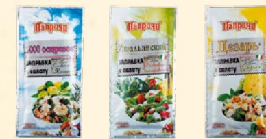
«Сливочно-ликантная» к салату «1000 островов» 40 г «Оливковая с травами» к салату «Итальянский» 40 г «Сырная» к салату «Цезарь» 40 г