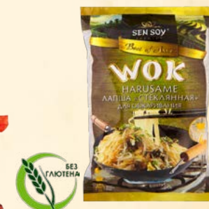
HARUSAME ЛАПША «СТЕКЛЯННАЯ» ДЛЯ ОБЖАРИВАНИЯ