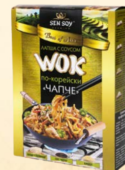
WOK по-корейски: ЛАПША БОБОВАЯ HARUSAME, С СОУСОМ CHAPCHAE И КУНЖУТОМ