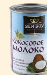
КОКОСОВОЕ МОЛОКО COCONUT MILK (5-7% ЖИРНОСТИ)