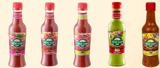
«Аджика» 310 г «Жгучий Чили» 310 г «Сладкий Чили» 310 г Соус «Васаби» 245 г Соус «Кисло-сладкий» 245 г