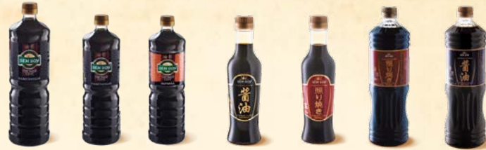
Соус соевый «Классический» (П3Т) - 1 л Соус соевый «Классический» (П3Т) - 500 мл Соус соевый «Маринад» (П3Т) - 500 мл Соус соевый «Классический» - стекло 220 мл Соус соевый «Терияки» - стекло 220 мл Соус соевый «Терияки» (П3Т) - 1 л Соус соевый «Для суши» (П3Т) - 1 л