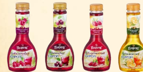
Сироп «Малиновый» 330 мл Сироп «Вишневый» 330 мл Сироп «Клубничный» 330 мл Сироп «Лимонный» 330 мл