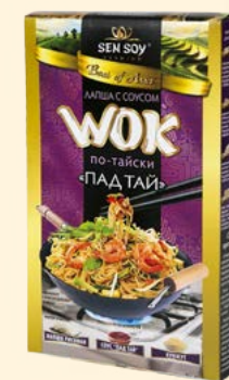
WOK по-тайски: ЛАПША РИСОВАЯ, С СОУСОМ PAD THAI И КУНЖУТОМ