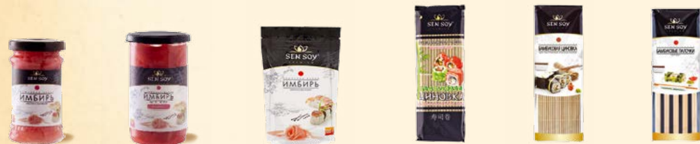
Имбирь маринованный (стекл. банка) - 145 г Имбирь маринованный «Розовый» (пласт. банка) - 350 г Имбирь маринованный (дойлак-zip) - 300 г Бамбуковая цинковая зеленая Professional form - 58,5 г Бамбуковая цинковая - 58,5 г Бамбуковые палочки для еды - 5 пар 35 г