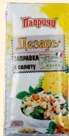
ЗАПРАВКА «СЫРНАЯ» К САЛАТУ «ЦЕЗАРЬ»

Металлизированный пакет 40 г Show-box 20 шт.