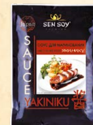
СОУС ДЛЯ МАРИНОВАНИЯ «ЯКИНИКУ»