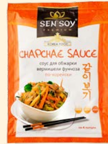
СОУС CHAPCHAE «ЧАПЧЕ» KOREAN TASTE Металлизированный пакет 80 г Show-box 15 шт.