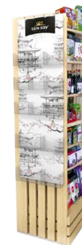
Деревянная ргото-стойка со съемной страйп-лентой