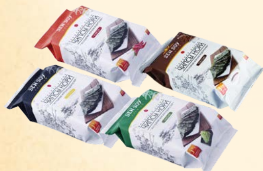
Чипсы «НОРИ»: ORIGINAL, WASABI, KIMCHI, TERIYAKI

Традиционные соусы-маринады марки Sen Soy Premium - это современное готовое решение для простого и быстрого приготовления популярных во всем мире блюд из мяса: Соус - маринад Yakiniiku «Якинику» (в пакете 80 г и в бутылке 500 мл), Соус- маринад Kalbi «Кальби», Соус - маринад Peking Duck «Утка по-пекински».