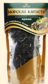
МОРСКАЯ КАПУСТА АРАМЕ