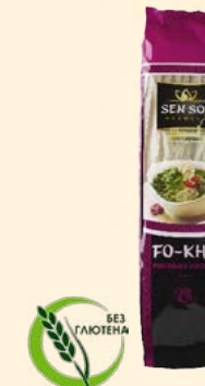
FO-KHO («ФО-ХО») THAI TASTE ШИРОКАЯ РИСОВАЯ ЛАПША