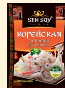
ЗАПРАВКА ДЛЯ ФУНЧОЗЫ

Металлизированный пакет 80 г Show-box 20 шт.