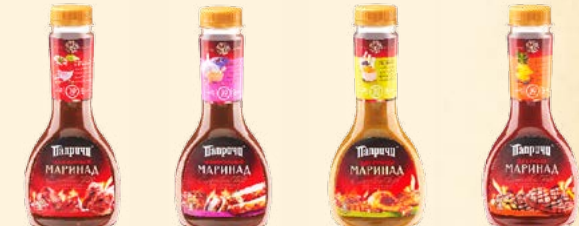
Маринад «Шашлычный» 400 г Маринад «Универсальный» 400 г Маринад «Для курицы» 380 г Маринад «Для гриля» 420 г