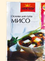
ОСНОВА ДЛЯ СУПА «МИСО» (MISO)