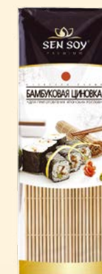
БАМБУКОВАЯ ЦИНОВКА Пластиковый пакет 58,5 г Show-box 10 шт. Короб 60 шт.