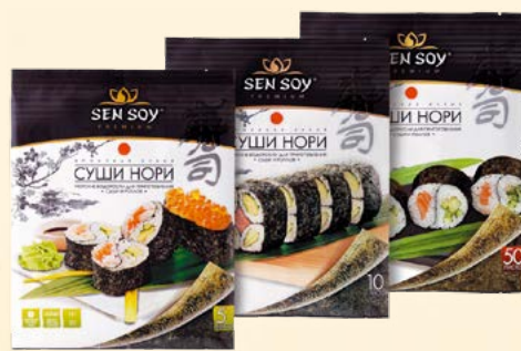
«СУШИ-НОРИ» JAPANESE TASTE Металлизир. пакет Металлизир. пакет Металлизир. пакет 5 листов (14 г) 10 листов (28 г) 50 листов (140 г) Диспенсер 36 шт. Диспенсер 20 шт. Диспенсер 10 шт.