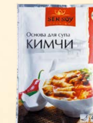
ОСНОВА ДЛЯ СУПА «КИМЧИ» (KIMCHI)

Металлизированный пакет 80 г Show-box 15 шт.