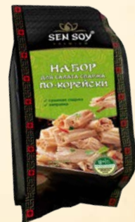
НАБОР ДЛЯ САЛАТА «СПАРЖА ПО-КОРЕЙСКИ»