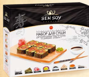
«НАБОР ДЛЯ СУШИ» JAPANESE TASTE Короб картонный 394 г Короб 4 шт.

Соус «Хрен-Васаби» с приятным острым вкусом. С этим соусом легко готовить популярные spicy-sushi. Также этот соус прекрасно дополнит блюда из мяса, птицы, рыбы и овощей.