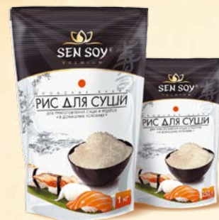
РИС ДЛЯ СУШИ SUSHI RICE JAPANESE TASTE Пластиковый пакет Пластиковый пакет 1 кг 250 г Короб 6 шт. Короб 24 шт.