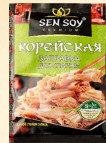
ЗАПРАВКА ДЛЯ СПАРЖИ

Металлизированный пакет 80 г Show-box 20 шт.