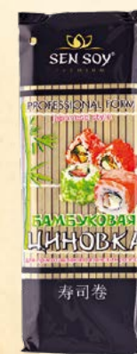
ПРОФЕССИОНАЛЬНАЯ БАМБУКОВАЯ ЦИНОВКА JAPANESE TASTE Пластиковый пакет 58,5 г Show-box 10 шт. Короб 60 шт.