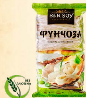
ФУНЧОЗА БОБОВАЯ PAN-ASIAN TASTE ШИРОКАЯ ПЛОСКАЯ ЛАПША