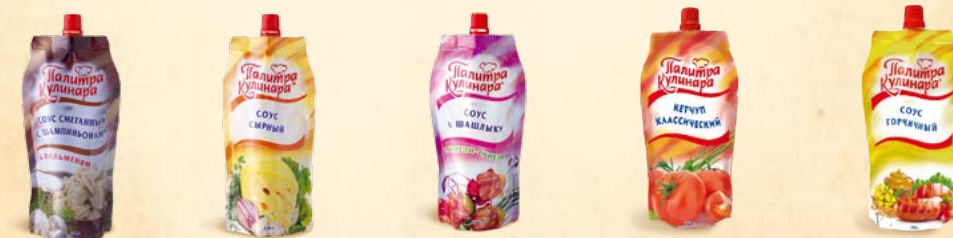
Соус «Сметанный с шампиньонами» 250 г Соус «Сырный» 250 г Соус «К шашлыку» 250 г Кетчуп «Классический» 250 г Соус «Горчичный» 250 г