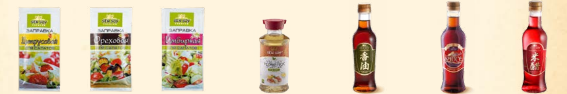
Заправка для салатов «Цитрусовая» - 40 г Заправка для салатов «Ореховая» - 40 г Заправка для салатов «Имбирная» - 40 г Рисовый уксус «приправа» (стекл. бут.) - 150 мл Кунжутное масло (стекл. бут.) - 220 мл Рыбный соус (стекл. бут.) - 220 мл Рисовый уксус красный «Приправа для салата» (стекл. бут.) - 220 мл