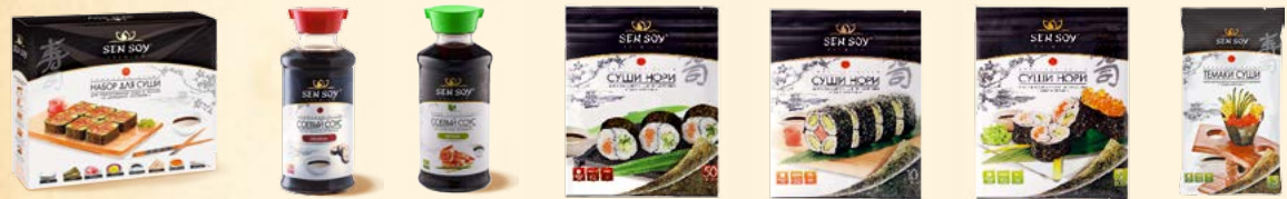
Набор «Для суши» - картонный короб 394 г Соус соевый ORIGINAL - стекл. диспенсер 150 мл Соевый соус «Легкий» - стекл. диспенсер 150 мл Морская водоросль «Суши-Нори» - 50 листов 140 г Морская водоросль «Суши-Нори» - 10 листов 28 г Морская водоросль «Суши-Нори» - 5 листов 14 г Морские водоросли сушеные обжаренные «Суши Темаки» - 15 листов /20 г