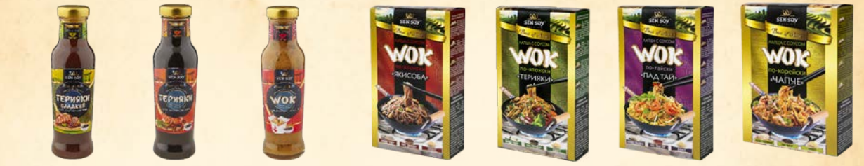
Соус ТЕРИЯКИ СЛАДКИЙ Для обжарки мяса, рыбы 320 г Соус ТЕРИЯКИ Для маринования 320 г Соус WOK Для обжарки лапши 310 г WOK по-японски: лапша гречневая SOBA, с соусом YAKISOBA и кунжутом 235 г WOK по-японски: лапша пшеничная UDON, с соусом TERUYAKI и кунжутом 275 г WOK по-тайски: лапша рисовая, с соусом PAD THAI и кунжутом 235 г WOK по-корейски: лапша бобовая HARUSAME, с соусом CHARCHOE и кунжутом 235 г