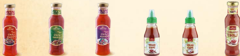
Соус Chili Sweet «Чили Сладкий» Стекло, 320 г Соус Chili Pineapple «Чили Ананас» Стекло, 320 г Соус Chili Mango «Чили Манго» Стекло, 320 г SHRIRACHA CHILI SAUCE 150 г SHRIRACHA CHILI SAUCE с чесноком 150 г SHRIRACHA CHILI SAUCE 320 г