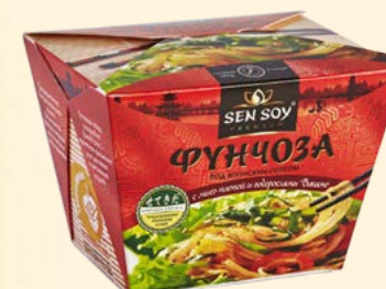
ФУНЧОЗА ПОД ЯПОНСКИМ СОУСОМ С ПАСТОЙ МИСО И ВОДОРΟΣЛЯМИ ВАКАМЕ JAPANESE TASTE SHOP & HoReCa Термостойкий картон 125 г Короб - 12 шт.

Готовый обед в китайском стиле содержит аутентичный китайский соус, основу которого составляет соевый соус, измельченные грибы шиитаке, древесный гриб, устричный соус, пряности. Также в ланч-боксе имеется пакет с жареным арахисом.