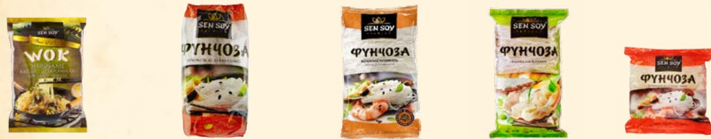
HARUSAME Лапша «Стеклопая» для обжаривания 150 г Вермишель «Фунчоза» 400 г Вермишель «Фунчоза» 200 г Лапша «Фунчоза» 180 г Вермишель «Фунчоза» 100г