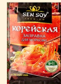
ЗАПРАВКА ДЛЯ МОРКОВИ

Металлизированный пакет 80 г Show-box 20 шт.