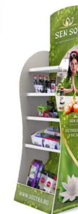
Пластиковая и картонная ргото-стойка

Работая с Компанией «СОСТРА» Вы получаете очень важное преимущество: надежный и стабильный партнер в лице Компании – производителя. А мы стараемся сделать все, чтобы Вы были успешными вместе с нами!