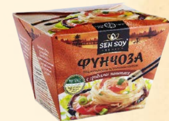
ФУНЧОЗА ПОД КИТАЙСКИМ УСТРИЧНЫМ СОУСОМ С ГРИБАМИ ШИИТАКЕ CHINESE TASTE SHOP & HoReCa Термостойкий картон 125 г Короб - 12 шт.