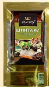
ГРИБЫ ЦЕЛЫЕ ШИИТАКЕ

Сухие ингредиенты линейки имеют широкое применение: используют для приготовления салатов, добавляют в супы и вторые блюда. Популярны в диетическом питании и вегетарианской кухне. Соевая спаржа прекрасно сочетается с овощами и мясом; ее тушат и обжаривают, готовят холодные острые салаты. Грибы шиитаке веками ценились императорами Азии за целебные, омолаживающие свойства, изысканный вкус. Водоросли Араме – ароматное и полезное украшение для салатов и супов, очень ценится в Японии, богато микроэлементами (магний, калий, железо, цинк и т.п.).