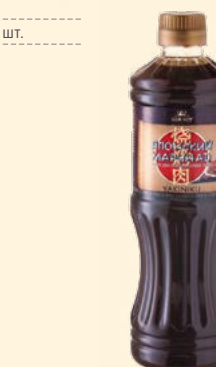
МАРИНАД «ЯКИНИКУ» (YAKINIKU)

Стеклобутылка 150 мл ПВД упаковка - 6 шт