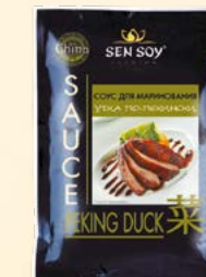
СОУС ДЛЯ МАРИНОВАНИЯ «УТКА ПО-ПЕКИНСКИ»

Металлизированный пакет 80 г Show-box 15 шт.