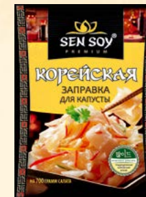
ЗАПРАВКА ДЛЯ КАПУСТЫ

Металлизированный пакет 80 г Show-box 20 шт.