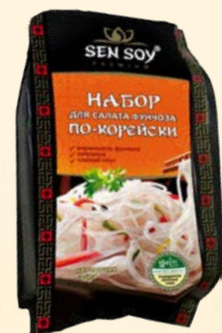
НАБОР ДЛЯ САЛАТА «ФУНЧОЗА ПО-КОРЕЙСКИ»