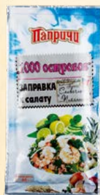
ЗАПРАВКА «СЛИВОЧНО-ПИКАНТНАЯ» К САЛАТУ «1000 ОСТРОВОВ»

В составе линейки имеются маленькие порционные соусы-заправки для приготовления знаменитых и любимых во всем мире салатов. Их можно приготовить с помощью заправок Папричи в считанные минуты на работе, дома, на пикнике.