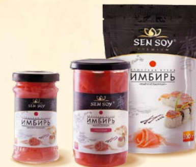
МАРИНОВАННЫЙ ИМБИРЬ Банка, стекло Банка, пластик Дойпак -ZIP 145 г 350 г 300 г Короб 24 шт. Короб 12 шт. Короб 18 шт.