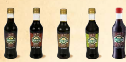
Соус соевый «Классический» - стекло 250 мл Соус соевый «Для суши» - стекло 250 мл Соус соевый «Пряный» - стекло 250 мл Соус соевый «Легкий» - стекло 250 мл Соус соевый «Классический» (П3Т) - 280 мл