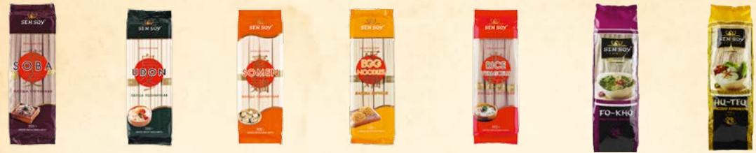
Лапша гречневая SOBA 300 г Лапша пшеничная UDON 300 г Лапша пшеничная SOMEN 300 г Лапша яичная EGG NOODLES 300 г Лапша рисовая RICE VERMICELLI 300 г Рисовая лапша «Фо-Хо» 200 г Рисовая вермишель «Ху-Теу» 200 г