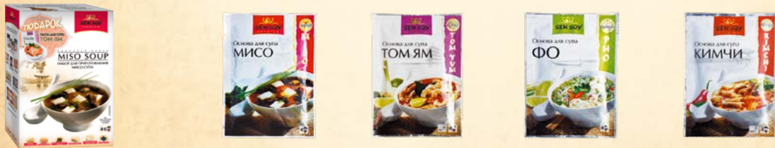
Набор для приготовления мисо-супа - 160 г Основа для супа «МИСО» (MISO) - 80 г Основа для супа «ТОМ ЯМ» (Tom Yam) - 80 г Основа для супа «ФО» (Pho) - 80 г Основа для супа «КИМЧИ» (Kimchi) - 80 г