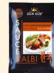
СОУС ДЛЯ МАРИНОВАНИЯ «КАЛЬБИ»

Металлизированный пакет 80 г Show-box 15 шт.