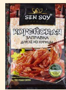
ЗАПРАВКА ДЛЯ ХЕ ИЗ КУРИЦЫ

Металлизированный пакет 80 г Show-box 20 шт.