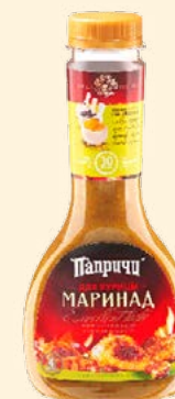
МАРИНАД ДЛЯ КУРИЦЫ