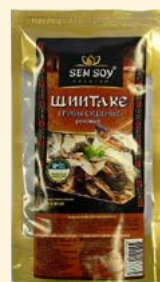
ГРИБЫ РЕЗАННЫЕ ШИИТАКЕ