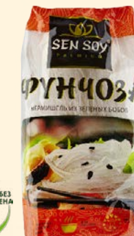
ФУНЧОЗА PAN-ASIAN TASTE БОБОВАЯ ВЕРМИШЕЛЬ

Пластиковый пакет 400 г 200 г 100 г Кор. 15 шт. Кор. 36 шт. Кор. 50 шт.