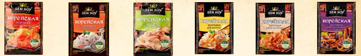
Заправка для моркови - 80 г Заправка для фунчозы - 80 г Заправка для спаржи - 80 г Заправка для картофеля - 80 г Заправка для хе из курицы - 80 г Заправка для баклажанов и грибов - 80 г