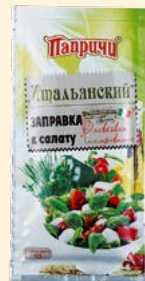
ЗАПРАВКА «ОЛИВКОВАЯ С ТРАВАМИ» К САЛАТУ «ИТАЛЬЯНСКИЙ»

Металлизированный пакет 40 г Show-box 20 шт.