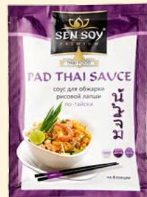
СОУС PAD THAI «ПАД ТАЙ» THAI TASTE Металлизированный пакет 80 г Show-box 15 шт.