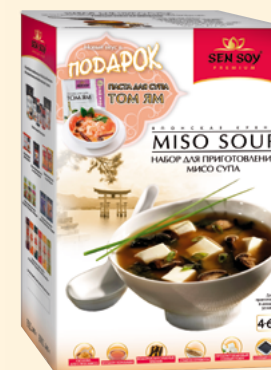
НАБОР ДЛЯ ПРИГОТОВЛЕНИЯ МИСО-СУПА

Основы для вьетнамского куриного супа с лапшой «Фо» (Pho) - это экзотическое сочетание жгучего имбиря, пряного кардомона, изысканного аниса и корицы.