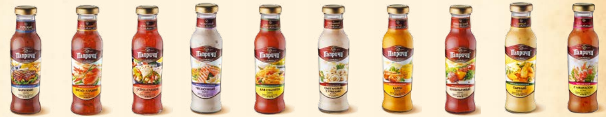
Американская кухня «Барбекю» Стекло, 320 г Китайская кухня «Кисло-сладкий» Стекло, 320 г Китайская кухня «Остро-сладкий» Стекло, 320 г Французская кухня «Чесночный» Стекло, 300 г Итальянская кухня «Для спагетти» Стекло, 320 г Русская кухня «Сметанный с грибами» Стекло, 300 г Индийская кухня «Карри» Стекло, 300 г Грузинская кухня «Шашлычный» Стекло, 320 г Итальянская кухня «Сырный» Стекло, 300 г Тайская кухня «С Ананасом» Стекло, 300 г