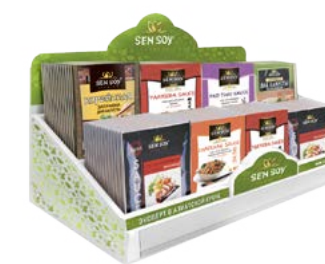
Настольный дисплей для продукции в мягкой упаковке