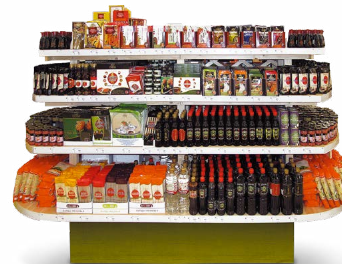
Деревянная ргото-стойка «Пирамида»

Компания «СОСТРА» поддерживает своих бизнес-партнеров, предлагая для продвижения продукции в торговых точках фирменные POS-материалы, включая торговое оборудование, которое концентрирует и демонстрирует богатство ассортимента экзотических продуктов питания и, как следствие, способствуют росту продаж (в 3-10 раз).