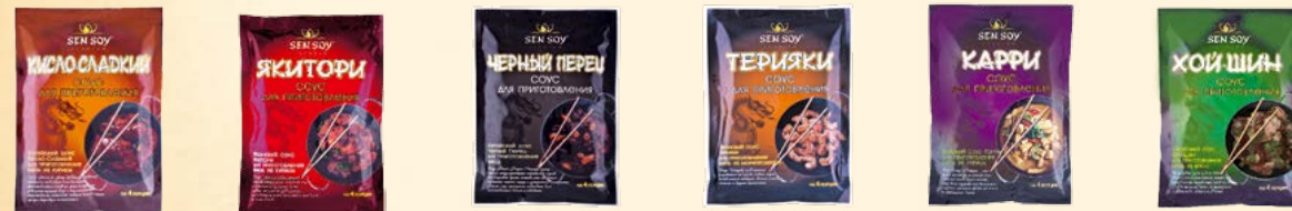
Соус «Кисло-сладкий» (Sweet & Sour) 120 г Соус «Якитори» (Yakitori) 120 г Соус с черным перцем (Black Pepper) 120 г Соус «Терияки» (Teriyaki) 120 г Соус «Карри» (Curry) 120 г Соус «Хой Шин» (Hoi Sin) 120 г