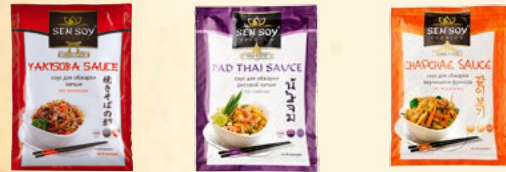
Соус для обжарки лапши «Якисоба» (YAKISOBA SAUCE) 80 г Соус для обжарки рисовой лапши «Пад Тай» (PAD THAI SAUCE) 80 г Соус для обжарки вермишели фунчоза «Чачне» (CHARCHOE SAUCE) 80 г