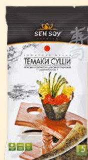
МОРСКАЯ ВОДОРОСЛЬ «ТЕМАКИ-СУШИ» JAPANESE TASTE Пластиковый пакет 15 листов 20 г Коробка диспенсер 20 шт.