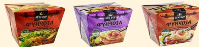
Вермишель «Фунчоза» под японским соусом с пастой мисо и водорослями вакаме 125 г Вермишель «Фунчоза» под тайским соусом с ананасом и тамариндом 125 г Вермишель «Фунчоза» под китайским устричным соусом с грибами шиитаке 125 г