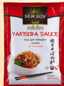
СОУС YAKISOBA «ЯКИСОБА» JAPANESE TASTE Металлизированный пакет 80 г Show-box 15 шт.

Соус Chapchae («Чапче») – традиционный корейский соус для бобовой лапши фунчоза (стеклянная лапша). Аппетитное сочетание ингредиентов: грибы шиитаке, натуральный соевый и устричный соус, рыбный бульон и традиционные пряности.