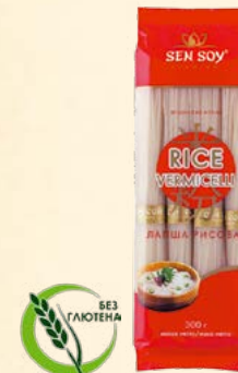
RICE VERMICELLI JAPANESE TASTE РИСОВАЯ ВЕРМИШЕЛЬ