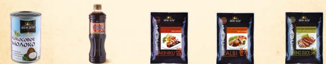
Кокосовое молоко Coconut Milk (банка) - 400 мл Соус «Японский маринад» Yakiniku (П3Т) - 500 мл Маринад «Якинику» (Yakiniku) - 80г Маринад «Кальби» (Kalbi) - 80 г Маринад «Утка по-пекински» (Peking Duck) - 80 г