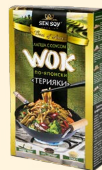
WOK по-японски: ЛАПША ПШЕНИЧНАЯ UDON, С СОУСОМ TERYAKI И КУНЖУТОМ