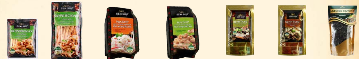
Спаржа соевая сушеная (пакет) - 110 г / 200 г Набор для приготовления салата «Фунчоза по-корейски» - 210 г Набор для приготовления салата «Спаржа по-корейски» - 190 г Целые сушеные грибы шиитаке - 20 г Резаные сушеные грибы шиитаке - 20 г Морская капуста – водоросли сушеные «Араме» - 20 г