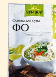
ОСНОВА ДЛЯ СУПА «ФО» (PHO)

Металлизированный пакет 80 г Show-box 15 шт.