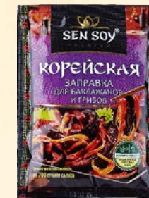
ЗАПРАВКА ДЛЯ БАКЛАЖАНОВ И ГРИБОВ

Металлизированный пакет 80 г Show-box 20 шт.