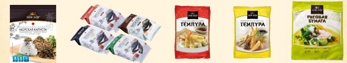
Обжаренные Хлопья - Нори с кунжутом (пластиковый пакет) - 30 г Чипсы нори Original, Wasabi, Kimchi, Teriyaki (металлизированный пакет) - 4,5 г Хлопья «Темпура» панировочные японские (пакет) - 100 г Мука панировочная японская «Темпура» (пакет) - 150 г Рисовая бумага крупная, 22 мм (пакет) - 100г