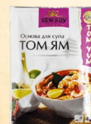
ОСНОВА ДЛЯ СУПА «ТОМ ЯМ» (ТОМ YUM)

Металлизированный пакет 80 г Show-box 15 шт.