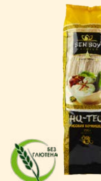
HU-TEU («ХУ-ТЕУ») VIETNAMESE TASTE ТОНКАЯ РИСОВАЯ ВЕРМИШЕЛЬ