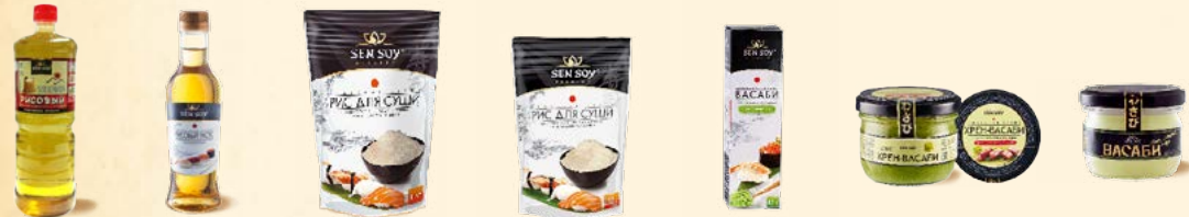
Рисовый уксус «Приправа для суши» - 1 л Рисовый уксус «Приправа для суши» - 220 мл Рис для суши (дойлак) - 1 кг Рис для суши (дойлак) - 250 г Приправа «Васаби» (тубик) - 43 г Васаби-хрен соус (стекл. банка) - 100 г Васаби, порошок (стекл. банка) - 40 г