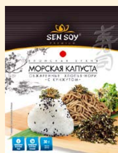
Обжаренные Хлопья - НОРИ с Кунжутом

Пластиковый пакет 30 г Коробка диспенсер 20 шт.