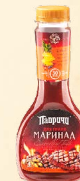
МАРИНАД ДЛЯ ГРИЛЯ