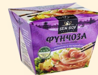
ФУНЧОЗА ПОД ТАЙСКИМ СОУСОМ С АНАНАСОМ И ТАМАРИНДОМ THAI TASTE SHOP & HoReCa Термостойкий картон 125 г Короб - 12 шт.