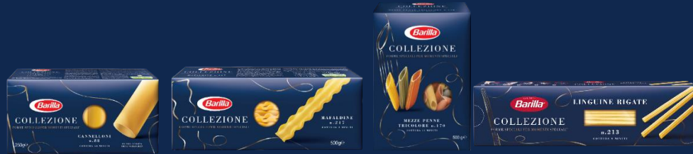
КАННЕЛЛОНИ, МАФАЛЬДИНЕ, МЕЦЦЕ ПЕННЕ ТРИКОЛОРЕ, ЛИНГВИНИ РИГАТЕ