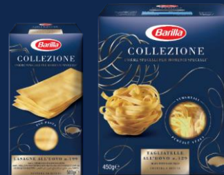
ЛАЗАНЬЯ ЯИЧНАЯ, ТАЛЪЯТЕЛЛЕ ЯИЧНЫЕ