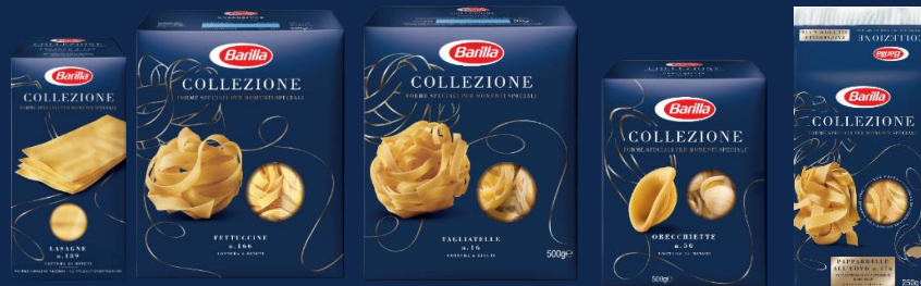
ЛАЗАНЬЯ, ФЕТТУЧИНЕ, ТАЛЪЯТЕЛЛЕ, ОРЕКЪЕТТЕ, ПАППАРДЕЛЛЕ ЯИЧНЫЕ